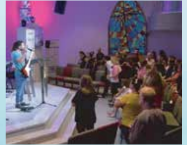
تسبيح وعبادة أثناء خدمة يوم الأحد في كنيسة القيامة ببيروت.

على الرغم من وجود الكنيسة في منطقة نزاعات استطاعت كنيسة القيامة أن تؤسس ثقافة الانتماء الروحي بين مؤمنين الكنيسة القائلين وبين الأعضاء الجدد القادمين من ثقافات مختلفة. نتيجة لذلك حدث تغييراً دائماً في قلوب أعضائها من المؤمنين حيث تحول العنف وعدم تقبل الآخر إلى سلام وحب ودمج اجتماعي.